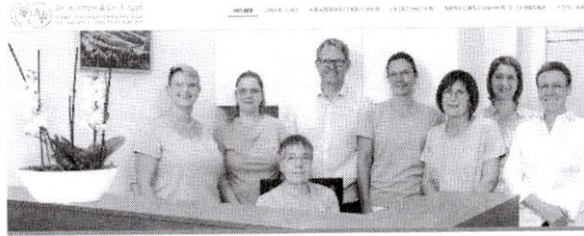
Gemeinschaftspraxis für Neurologie und Psychiatrie in Nierstein

Wir suchen zum 01.05.2024 (oder später) eine oder einen medizinische(n) Fachangestellte(n) für unsere neurologisch-psychiatrische Praxis in Nierstein.