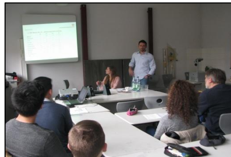
Aktion Berufsfeld Sport mit 05-Mitarbeitern Gymnasium am Mosbacher Berg Wiesbaden