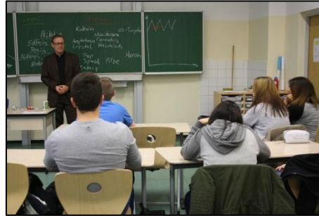
„Stay free“ – Rauchprävention mit der IKK Südwest Sophie-Scholl-Schule Mainz